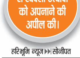
हरिभूमि न्यूज सोनीपत