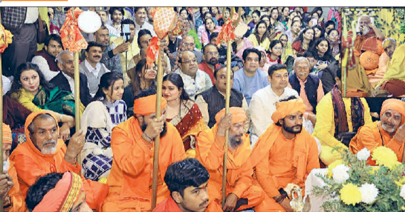
सोनीपत। सेक्टर 14 में शंकराचार्य स्वामी निश्चलानंद सरस्वती महाराज प्रवचन करते हुए तथा उपस्थित श्रद्धालुगण।