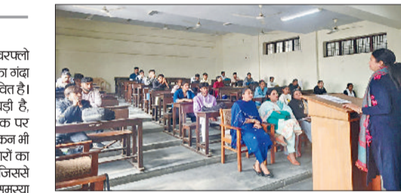
खरखोड़ा। श्रीमद्भगवत गीता की शिक्षाओं पर प्रकाश डालते वक्ता।