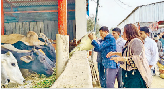
गोहाना। सेवानिवृत्त पर गोशाला में गायों को चारा डालते तहसीलदार एवं उनकी पत्नी।