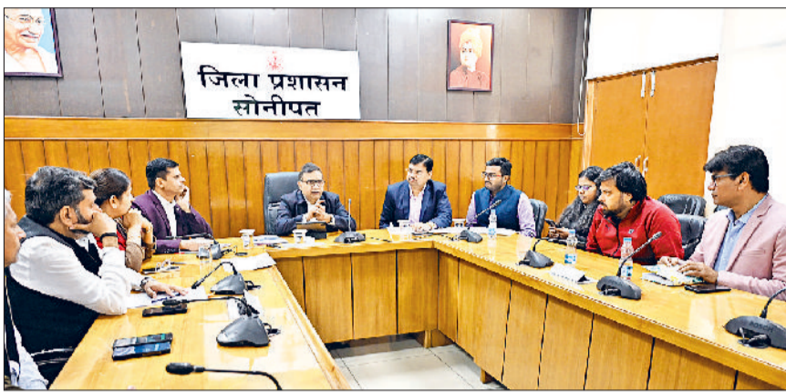
सोनीपत। बैठक के दौरान अधिकारियों के साथ उपायुक्त।

लघु सचिवालय में अधिकारियों के साथ सड़क सुरक्षा एवं सुरक्षित स्कूल वाहन पॉलिसी समिति की मासिक बैठक का आयोजन