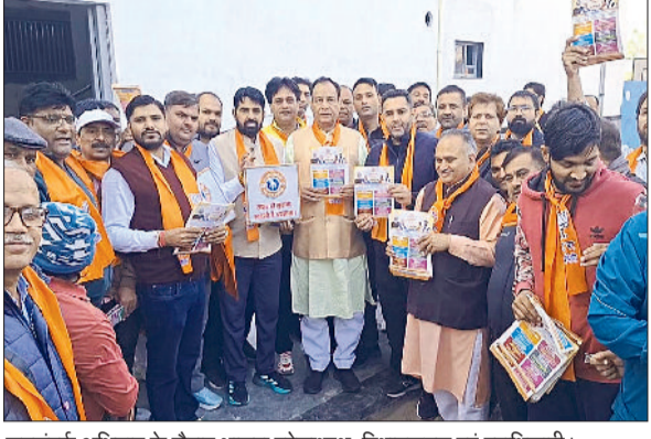
जनसंपर्क अभियान के दौरान भाजपा प्रदेशाध्यक्ष, विधायकगण एवं पदाधिकारी।